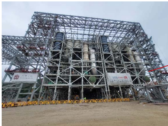
主焚化爐大樓鋼結構及 鍋爐組件安放