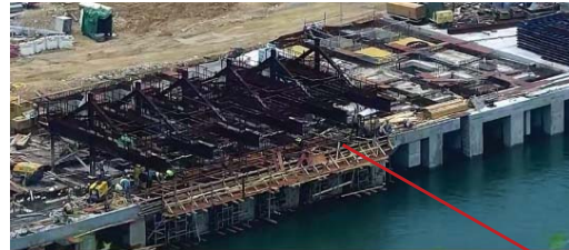
海堤和碼頭 沉箱結構施 工