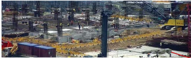
各大樓地基及上部結構施工