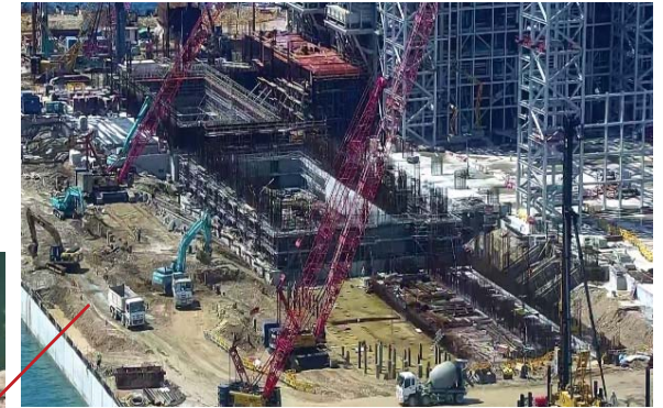
鍋爐廠房樁帽及大樓施工